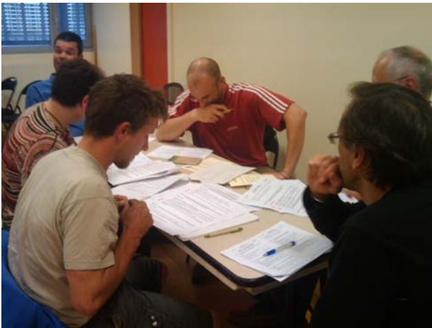
Groupe 2 travaillant sur l'axe 4 : La mobilisation de l'économie au service du développement durable