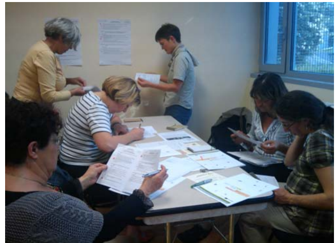
Groupe 1 travaillant sur l'axe 3 : Des services de qualité pour un bassin de vie attractif et solidaire attractif et solidaire