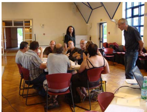
Groupe 3 travaillant sur l'axe 5