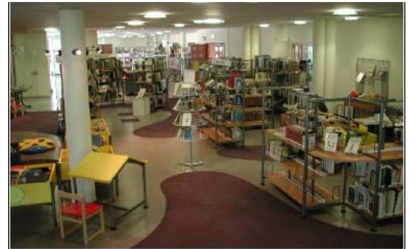
La Médiathèque de Scionzier