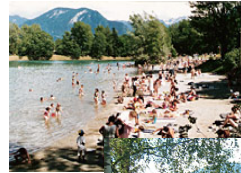
Lacs de Thyez (site Internet de la Ville de Thyez)

L'espace de loisirs des « Lacs de Thyez » : un des poumons verts du bas de vallée, où il y a peu d'espaces de loisirs (hors sport)