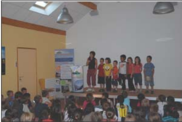
Remise du 1er prix du concours « Ma planète en tête 2009 » à une classe de l'école de Messy (Cluses) pour leur travail sur le tri et le compostage

Des actions d'Education au Développement Durable dans certaines classes ... à développer