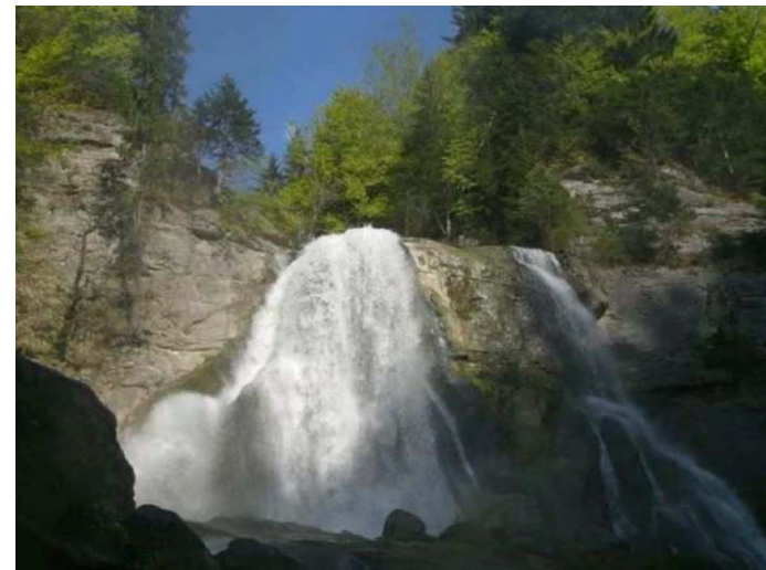
Cascade du Dard (Mont Saxonnex)