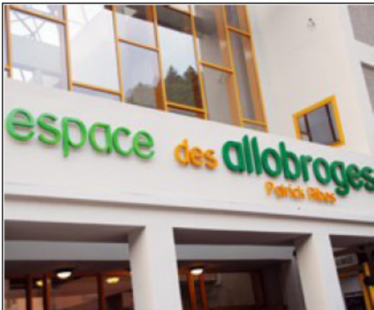
L'Espace culturel des Allobroges à Cluses propose du théâtre, du cinéma, des expositions, des spectacles,...

... Assez peu d'associations ou de structures tout public pour l'expression artistique au regard du nombre d'habitants