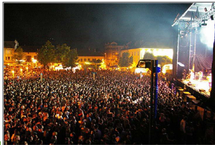
Festival Musique en Stock à Cluses